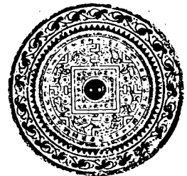
新、始建国天鳳二年 四神博局鏡

ここでは紹介しなかったが、このあと重列式の鏡が現れてくる。これは階段上に西王母・東王父などの神仙や神獸が配置される。そ