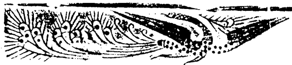
鳳（朱雀）『河南新鄭画像磚』72頁

四神の中でもっとも形成が遅れるのが玄武であろう。青龍・白虎・朱雀とのバランスからいうと玄龜とよばれてもよさそうだが、なぜか玄武である。玄武のみが龜と蛇という二匹の動物のあわせだったものである。